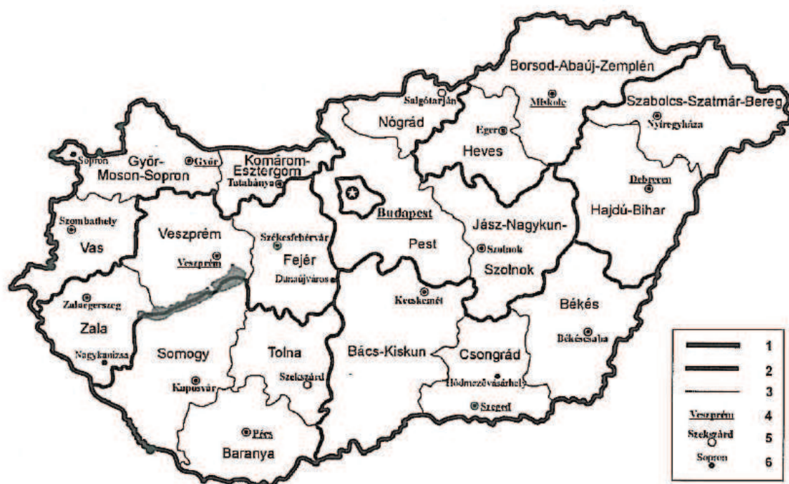
2. ábra A köztársasági megbízotti régiók (1990-1994)

Jelmagyarázat: 1 – Országhatár; 2 – Köztársasági megbízotti régió határa; 3 – Megyehatár; 4 – Köztársasági megbízotti székhely; 5 – Megyeszékhely; 6 – Megyei jogú város